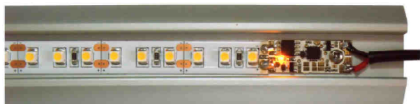
Obr.4 - Ukázka instalace do profilu